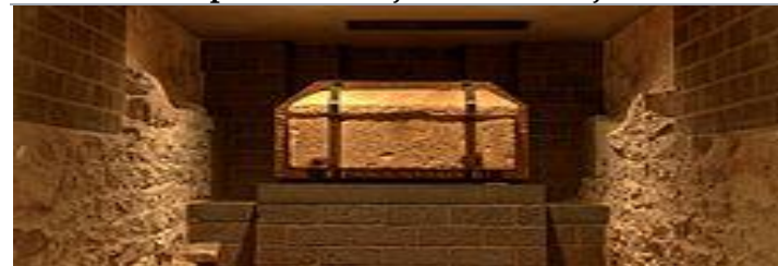
Sarkofag apostola Matije u Trieru

Matija je zamijenio Judu, koji je počinio samoubojstvo iz očaja zbog izdaje koju je počinio protiv Isusa (Dj 1,15-26 EU). Prema priči iz Djela apostolskih, Matija je izabran ždrijebom (kockom) između njega i još jednog vjernog suputnika Isusa i apostola po imenu Josip Barsaba (Dj 1,21-26 EU). Nema daljnjih referenci na apostola u Novom zavjetu. Ime znači "Dar YHWH" (Božji). Prema legendi, kosti apostola Matije pronađene su u Palestini više od 250 godina nakon njegove smrti. Prema predaji propovijedao je u Judeji, Kapadociji i uz Kaspijsko jezero. Umro je mučeničkom smrću. Pripisuje mu se apokrifno Evangelje po Matiji . Kosti je donio u Trier, trierski biskup Agritius. Godine 1127. vjerovalo se da su ljudske kosti pronađene u benediktinskoj opatiji svetog Matije u Trieru relikvije apostola Matije, koje su stoljećima bile izgubljene. Od tada ih časte hodočasnici u crkvi opatije. Matijin je kult bio osobito živ u srednjem vijeku. O brojnosti hodočasnika svjedoči bratovštinska knjiga s 4670 zapisa od sredine 12. do početka 13. stoljeća. Hodočasnici iz Porajnja posebno dolaze u Trier tijekom sezone hodočašća. Mnogi su krenuli pješice. Ova hodočašća provodi Bratovština sv. Matije.